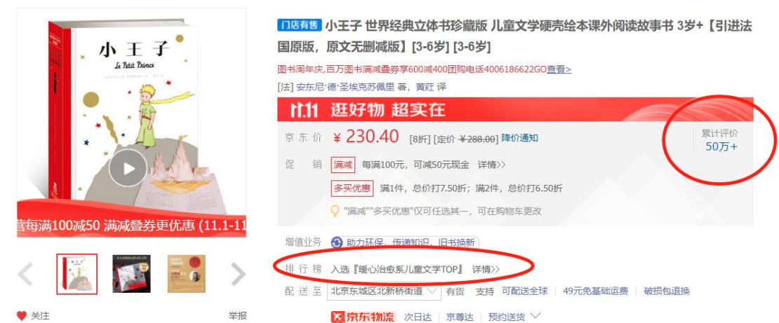
入选畅销榜单，累计评价 50 万+

2.将本书以立体书的形式出版是因为，近些年以立体书形式出版的读物基本都获得了极高的销量，成为了爆款图书，例如《小王子立体书》《我们的太空立体书》等都登上了儿童立体书畅销榜单，因此我认为，将本书创新优化为立体书形式更有利于后续的销量增长。